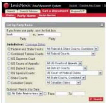
Get a Document / Party Name

条文や訴訟番号、裁判の当事者名があらかじめわかっている場合は、複雑なサーチは不要です。ドケット番号、判例や法令、ローレビューのサーテーション、または当事者名を入力するだけで、ご希望のドキュメント全文をダイレクトに取り出すことができます。