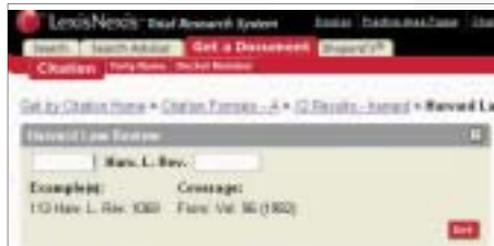
Get a Document / Citation

citation format assistant機能により、サイテーション形式を簡単にチェックできます。