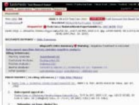
Shepard's® 引用分析サマリー

また、Shepard's Table of Authorities では、特定の判例などが法的根拠として引用している判例、制定法をリストアップします。Check a Citation 機能では、この他 Auto Cite®、LEXCITE® といったサイテーターが利用できます。